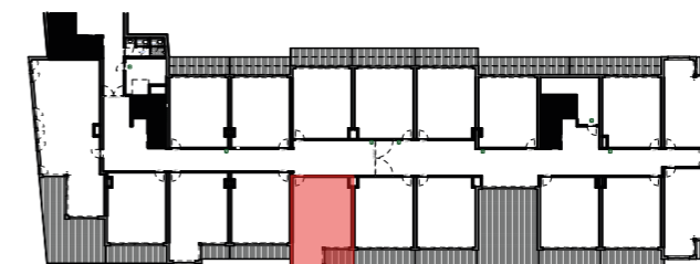
Totaalplan tweede verdieping